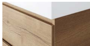
Aufliegende Artikelnummer mit WK