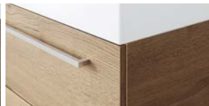
Typ D ausgestattet mit Griff