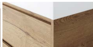
Innenliegenden Artikelnummer mit WKT